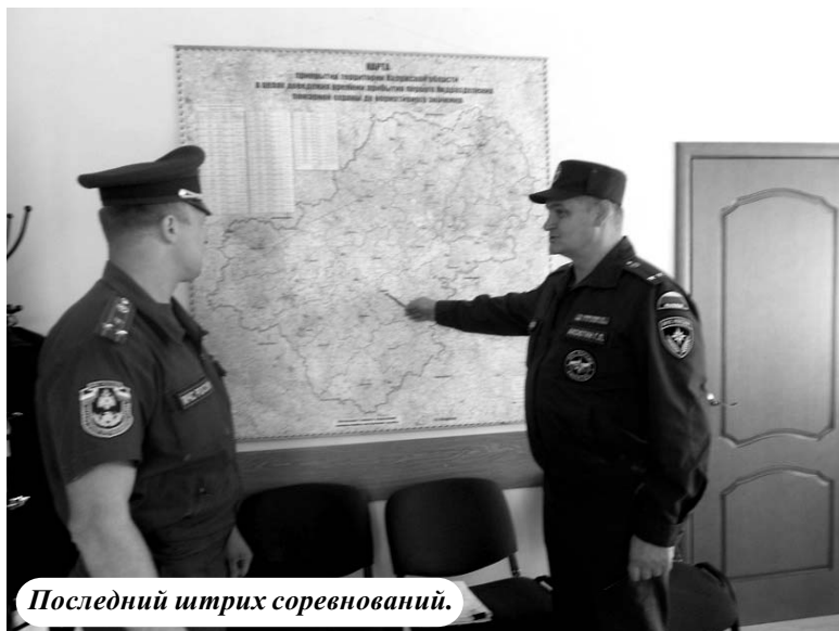
Последний штрих соревнований.

В программу соревнований входили конкурсы и виды спорта в соответствии с Положением о соревнованиях ДПО МЧС России: 1. Конкурс «Визитная карточка». 2. Комбинированная эстафета (соревнования по боевому развертыванию и проведению аварийно-спасательных работ). 3. Турнир по волейболу. 4. Юмористическая эстафета. 5. Турнир по домино.