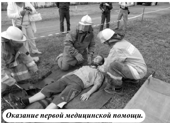
Оказание первой медицинской помощи.